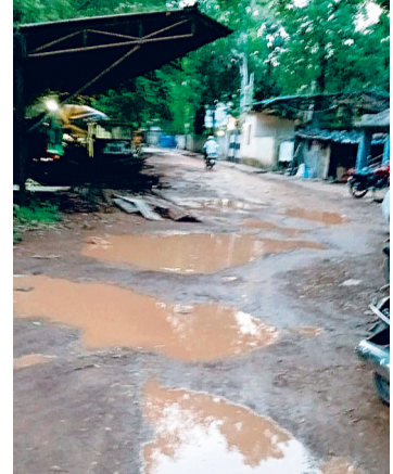
आम लोगों के साथ वकील एवं स्टॉफ भी परेशान