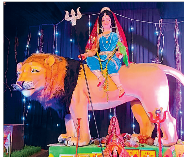
बलौदाबाजार: श्री ज्वाला दुर्गा उत्सव समिति रामलीला चौक खरोरा।