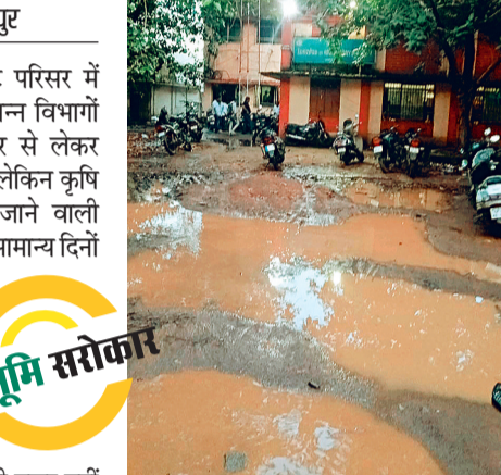
पंजीयन कार्यालय परिसर तक वाहन जाने के लिए एक ही रास्ता