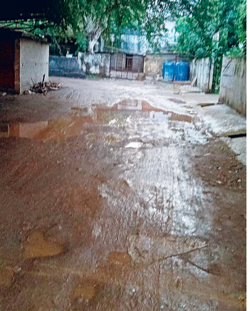
कृषि से पंजीयन कार्यालय का यह मार्ग पिछले कई वर्षों से इसी स्थिति में है। इसके बाद भी इस मार्ग को अब तक सुधारा नहीं गया है। इस मार्ग के अलावा पंजीयन कार्यालय का बाहरी परिसर में भी बारिश होने के बाद जलभराव की स्थिति बन जाती है, जिसके कारण लोग यहां खड़े नहीं हो पाते। इसके कारण आम लोगों के साथ वकील एवं कार्यालय के कर्मचारियों को भी परेशान होना पड़ता है।