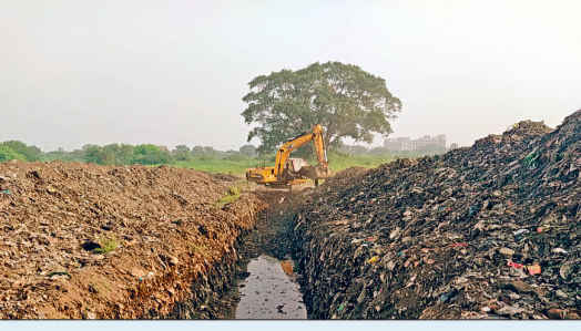
■ रायगढ़ की कंपनी को 12 करोड़ 64 लाख रुपये में मिला है ठेका

सरोना में बनेगा खेल मैदान और सुंदर गार्डन नगर निगम ने सरोना स्थित करीबन 24 एकड़ जमीन को सुरक्षित रखने 28 करोड़ रुपए का अनुमानित प्रोजेक्ट तैयार कर राज्य शासन के पास मंजूरी के लिए भेजा है। साइट विलियर होते ही वहां खेल मैदान बनेगा साथ ही सुंदर बगीचा विकसित करने की योजना है। खाली जमीन के एक तिहाई हिस्से में क्रिकेट, टेनिस जैसे खेलों को बढ़ावा देने खेल मैदान बनेगा। खेल मैदान और बगीचे में प्रकाश व्यवस्था के लिए सोलर फार्म बनाने की योजना बनाई गई है। पूरे परिसर के चारों ओर बड़े पैमाने पर पौधारोपण कर हर-भरा रखा जावेगा।