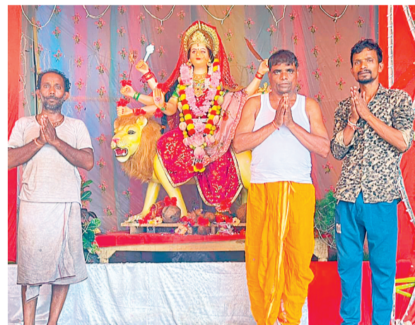
जय महामाई सार्वजनिक समिति दुर्गा उत्सव समिति मुरा